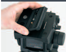
Das „Sideload“ System erlaubt das schnelle Aufsetzen, Einrichten und Abnehmen der Kamera.