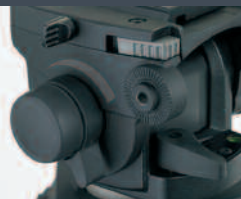
3-stufiger Gewichtsausgleich plus „0“-Position für extrem leichte Camcorder und eine einfach einzustellende Schwenk- und Neigedämpfung