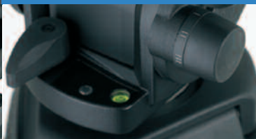
Beleuchtete Nivellierlibelle für den schnellen und bequemen Aufbau auch bei schlechter Beleuchtung